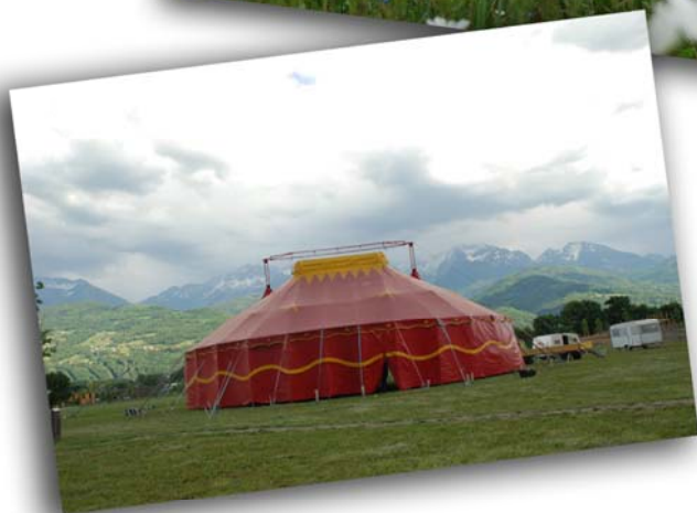
Vue de près